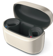
Phonak Charger RIC I