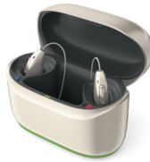
Phonak ChargerGo RIC I