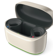
Phonak ChargerGo RIC Sphere I