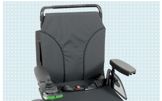
• Standard háttámla biztonsági övel