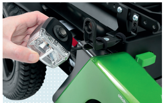
• Mágneses rögzítésű LED lámpa